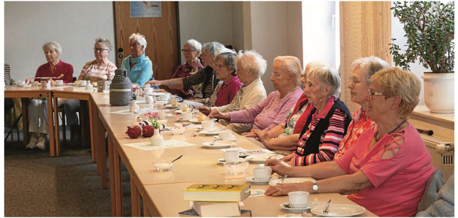
Im Erzählcafé „Dat weetst du noch“ stand jetzt das Thema „Geschäfte“ heute und damals auf der Agenda.

Im Kurzwarenladen Beyer war alles gut sortiert und von Knöpfen bis Büstenhal-