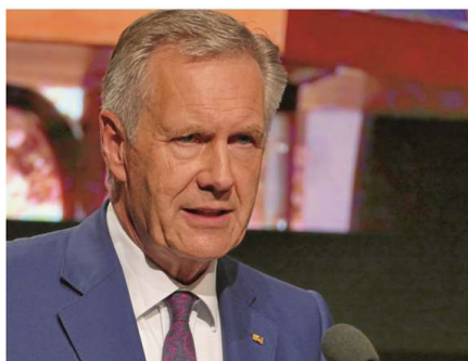
Alt-Bundespräsident Christian Wulff am Mikro.

Der 26. Tidentalk ist bereits online. Den Link zum Gespräch findet man auf der Seite des Staatsbades unter www.norderney.de . Der Talk erscheint jeden ersten Freitag im Monat auf allen gängigen Podcast-Plattformen.